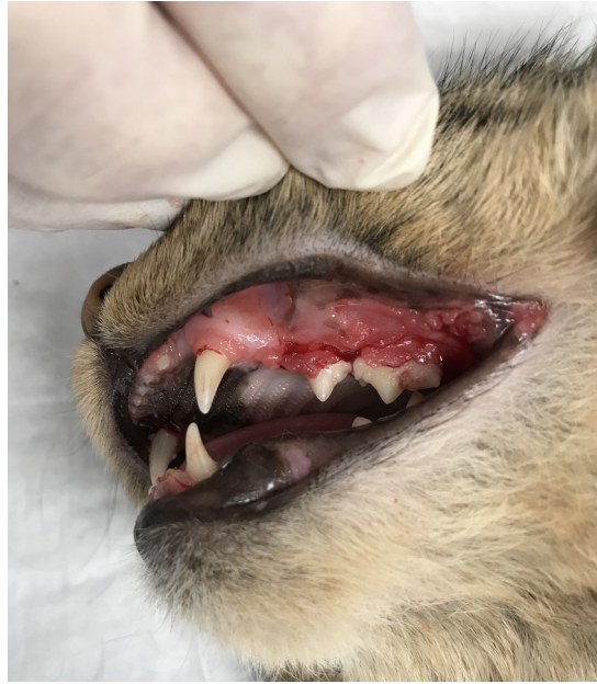
Bild: Feliner Gingivitis-/ Stomatitis Komplex Intermittierende Schmerzen!

Haben Sie Fragen, wie Sie die Gesunderhaltung der Zähne Ihres Lieblings positiv beeinflussen können und welches Produkt sich für Ihr Tier eignet? Zögern Sie nicht uns zu kontaktieren, wir geben Ihnen gerne Auskunft!