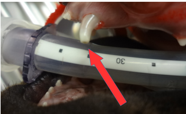
Bild: Abgebrochener Eckzahn bei einem Welpen (Milchzahn) Notfall!