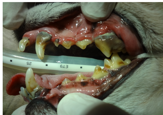
Bild: Hochgradige Zahnfleischentzündung (Gingivitis) mit hochgradiger Parodontose (Knochenschwund /-entzündung)