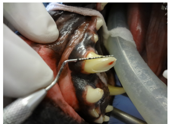
Bild: Abgebrochener Eckzahn eines Hundes, der Wurzelkanal ist eröffnet Notfall!